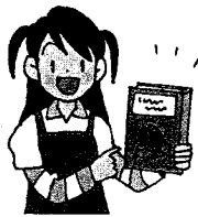
(1) this book

Let's try!! ① 次の絵を見て、「私は～だと思ひます」という文を書こう。