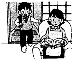
(2) come home