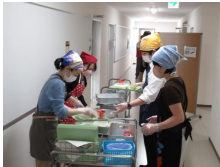
6月の配膳は先生がエプロン姿で実施