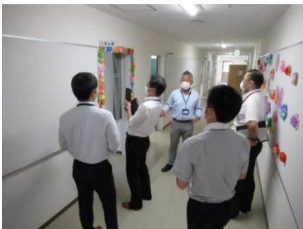
港区長や東京都教育委員会の方々も視察に來校されました