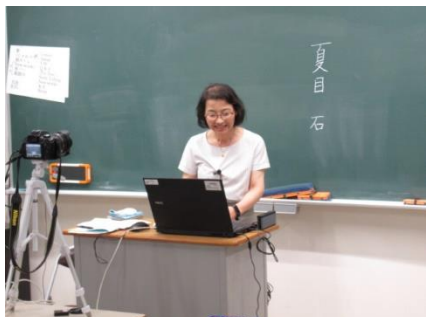
国語の授業はチャット機能も利用 生徒の意見もモニターに映ります