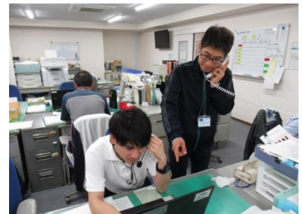
ICT担当の2名の先生は苦勞の連続。 生徒からの問い合わせにも即対応です