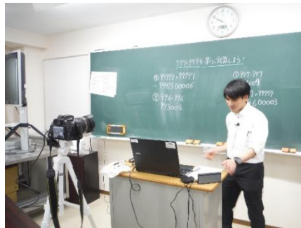
オンライン授業も3年生で試行 数学の授業