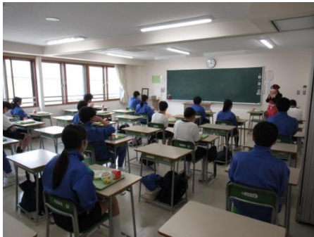
3密を避けるため座席配置