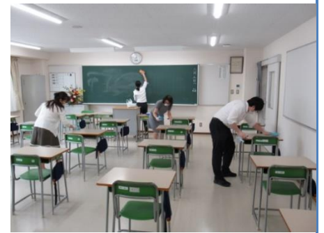
放課後の消毒は先生全員で念入りに