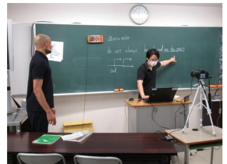
ネイティブティーチャーも参加して 英語の授業