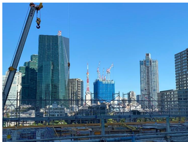
ビルの谷間に東京タワーも望めます(屋上より)