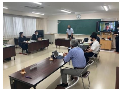
会議室で喫食と意見交換会