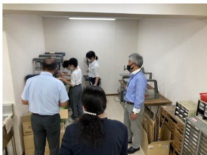
1年C組の技術の旋盤を使用した授業